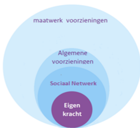
Figuur 1. Korte termijn

ondersteuning in de vorm van een maatwerkvoorziening verstrekt. Dit is een tijdelijke situatie. In de loop der tijd zal en moet er een verschuiving plaatsvinden naar algemene voorzieningen (zie figuur 1 en figuur 2). De jaren 2015 en 2016 gebruiken we om te komen tot een meer structurele situatie waarin het aanbod van algemene voorzieningen wordt opgebouwd en uitgebreid. Zo kunnen vormen van individuele begeleiding bijvoorbeeld ook (deels) door een zorgvrijwilliger worden gegeven, kunnen welzijnsorganisaties hun aanbod verbreden, of kunnen bijvoorbeeld sportverenigingen een vorm van dagbesteding bieden.